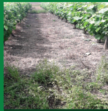
Εφαρμογή με Hikari