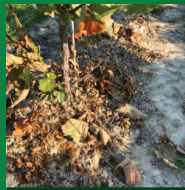
Εφαρμογή με Hikari